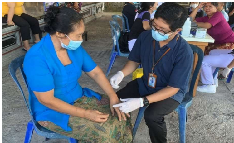
Gambar 2. Kegiatan pemberian edukasi tentang pemeriksaan kesehatan dan terapi akupunktur

Pada kegiatan pemberian edukasi terlihat peserta aktif menyimak, bertanya dan merespon dengan kooperatif dalam mengikuti kegiatan tersebut. Ada beberapa peserta kurang mengetahui tentang pelayanan kesehatan akupunktur dan kurang memahami tentang masalah kesehatan vertigo dan cara mengobati baik secara konvensional dan tradisional atau komplementer. Setelah mendapatkan gambaran tentang pengetahuan peserta tentang akupunktur dan masalah kesehatan vertigo, dengan diberikannya edukasi dan informasi, diharapkan pengetahuan masyarakat menjadi meningkat dari sebelumnya. Dengan meningkatnya pengetahuan masyarakat, diharapkan kesadaran dan motivasi masyarakat juga meningkat untuk selalu menjaga kesehatannya serta berperilaku hidup sehat dan mampu mengakses pelayanan kesehatan untuk mengatasi masalah kesehatannya.