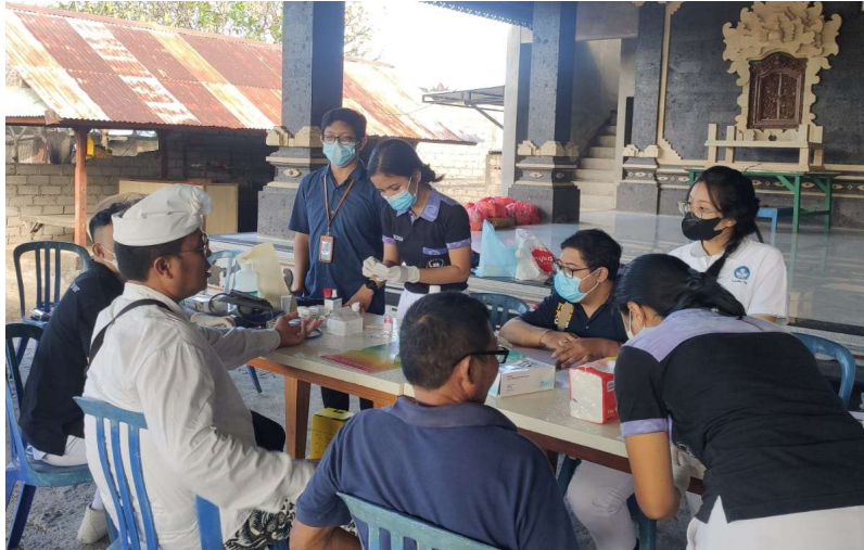
Gambar 1. Kegiatan pemberian edukasi kesehatan tentang akupunktur dan vertigo