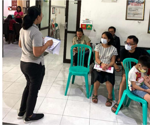
Gambar 2. Penjelasan mengenai pengisian Pretest dan Posttest