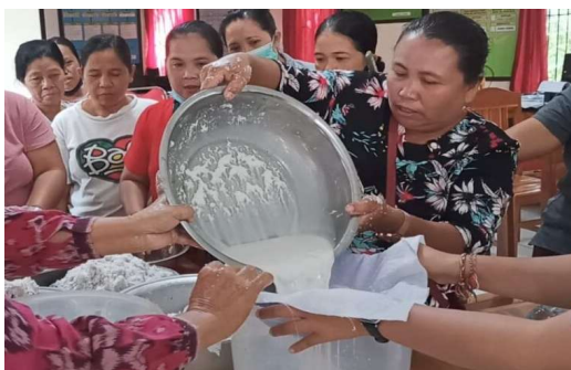
Gambar 2. Pelatihan Pembuatan Massage Oil

Berdasarkan gambar 2. diatas menunjukkan menunjukkan hasil pengetahuan posttest mengalami peningkatan setelah diberikan ada perbedaan tingkat pengetahuan ibu bersalin dan tenaga kesehatan sebelum dan sesudah diberikan penyuluhan tentang produk-produk olahan kelapa dan essential oil biji bunga matahari khususnya massage oil untuk ibu hamil dan bersalin dan potensi pasar dari produk tersebut.