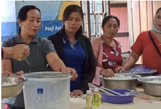
Gambar 1. Kegiatan PKM

laki sebanyak 18 orang (72,0%). Berpendidikan SMP yaitu sebanyak 11 orang (44,0%), seluruhnya bekerja sebagai petani sebanyak 25 orang (100,0%) dan memiliki penghasilan \leq 2 juta sebanyak 21 orang (84,0%).