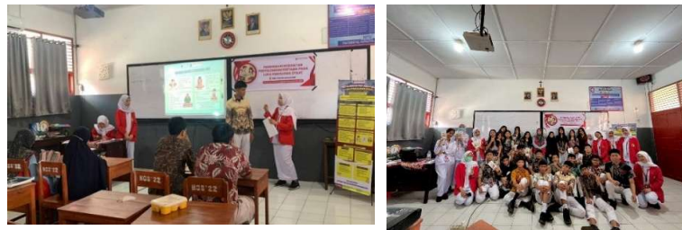
Gambar 1. Dokumentasi Kegiatan

Kegiatan psikoedukasi Pertolongan Pertama pada Luka Psikologis (P3LP) dilaksanakan pada Kamis, 16 Oktober 2025 di SMA Frater Makassar, Kecamatan Tamalate, Kota Makassar dengan melibatkan berbagai pihak sebagai bentuk kolaborasi psikoedukasi berbasis sekolah. Dosen pembimbing dan mahasiswa profesi ners Unhas bertindak sebagai fasilitator sekaligus narasumber dalam penyampaian materi, sedangkan guru Bimbingan Konseling (BK) dan petugas UKS berperan sebagai pendamping siswa selama kegiatan serta penghubung tindak lanjut apabila ditemukan siswa yang membutuhkan dukungan psikologis lanjutan. Pihak sekolah berperan dalam memfasilitasi tempat, koordinasi peserta, dan dukungan pelaksanaan program. Sementara itu, siswa kelas XII berperan aktif sebagai peserta sekaligus subjek utama yang dilatih untuk mengenali dan memberikan dukungan awal terhadap masalah psikologis pada teman sebaya.